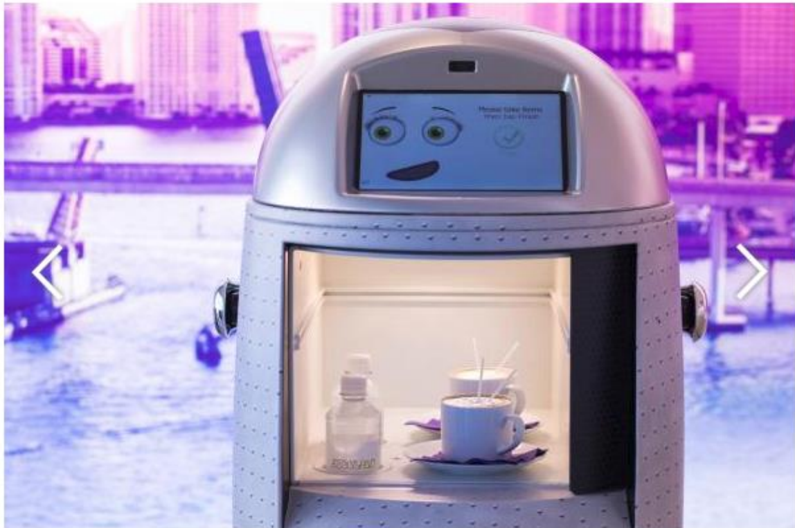
En 2020, el YotelPad ofrecerá tres robots mayordomos.