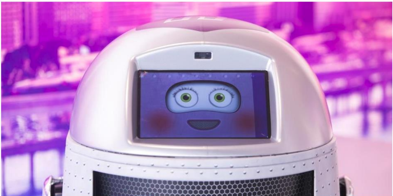
El primer robot mayordomo de Miami.

Está programado para hablar varios idiomas y puede cargar hasta 77 libras.